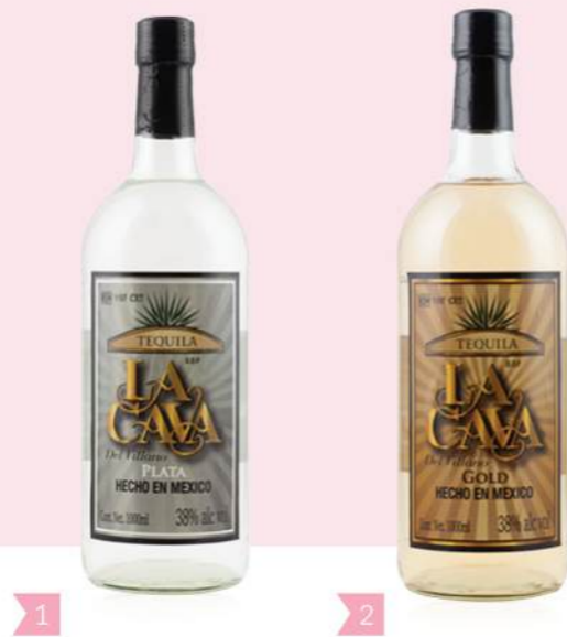
1 11574 LA CAVA DEL VILLANO PLATA Weißer Tequila UVP € 29,90 1000 ml • Flasche • 38 % vol. • Spanien • Premium Weißer Tequila

La Cava del Villano Plata zeigt eine helle Farbe mit einer perfekten Transparenz. Sein Aroma ist fruchtig und zitrusartig. Am Gaumen ist die Spirituose weich, süß und würzig mit Noten von Agave und Zitrusfrüchten. Mit seinem weichen Geschmack ist La Cava del Villano Plata die perfekte Basis für unzählige Cocktails und eignet sich bestens für den puren Genuss.