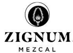
1 11567 ZIGNUM Mezcal Reposado UVP € 49,90 700 ml • Flasche • 40 % vol. • Mexiko • Premium Mezcal Reposado, 100% Espadín-Agave

Zignum Mezcal Reposado zeigt ein perfektes Gleichgewicht zwischen zarten und intensiven Noten.