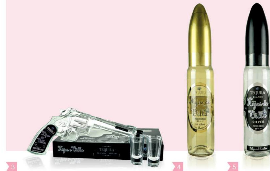
3 11621 HIJOS DE VILLA Tequila Blanco, Revolver/Shot Gläser UVP € 24,90 200 ml • Revolverflasche mit zwei Gläsern • 40 % vol. • Mexiko • Tequila aus Agaven

Mit mehr als 65 Jahren Erfahrung bietet Licores Veracruz ein breites Portfolio an hochwertigen Premium Produkten, die sowohl in Mexiko als auch international anerkannt und extrem nachgefragt werden. Das Produktspektrum der renommierten Firma umfasst verschiedene Rumsorten, Tequilas, Mezcale, Aguardientes und andere Destillate. Seine mehrfach ausgezeichneten Produkte werden in mindestens 30 verschiedene Länder weltweit exportiert.