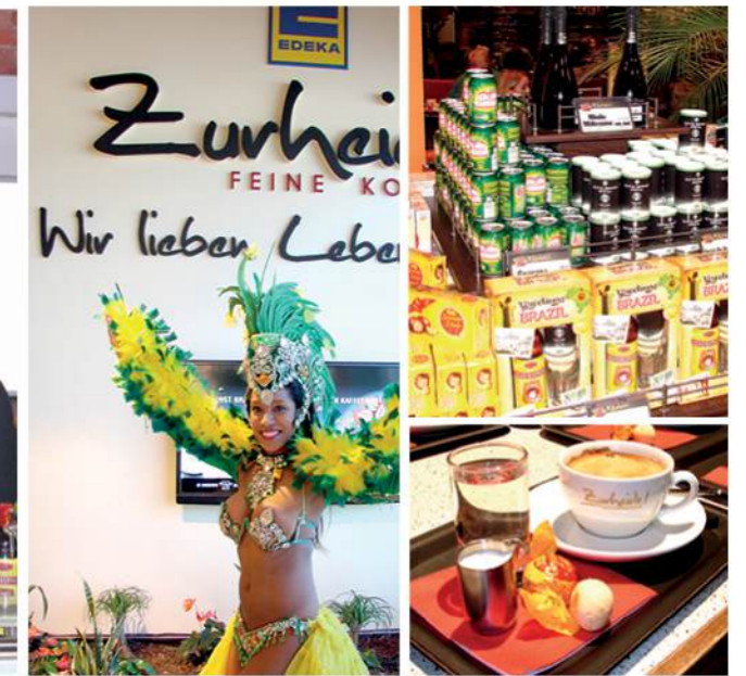
EDEKA ZURHEIDE DÜSSELDORF